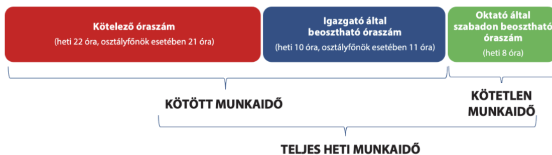
1. ábra Az oktató munkaidőbeosztásának sematikus ábrája

Az oktató munkaviszonya főszabály szerint általános teljes napi munkaidőben történő foglalkoztatásra jön létre. Ebből az oktató kötött munkaideje a tanítási évre vetített munkaidőkeret 80%-a, ami 36 tanítási héttel számítva 1152 óra, ami heti 32 órát jelent. A munkaidő fennmaradó részében az oktató munkaideje beosztását vagy felhasználását önmaga határozza meg (kötetlen munkaidő). A heti 32 órába beleszámít a foglalkozás (így a kötelező és szabadon választható foglalkozás, illetve az egyéb foglalkozás) és az annak nem minősülő, de a szakmai oktatással összefüggésben az igazgató által elrendelhető egyéb feladat. A 32 órából a kötelező óraszám az Szkr. 135. § (1) bekezdése szerint annak 70%-a, vagyis heti 22 óra (tanítási évre vetítve 792 óra), osztályfőnöki feladatokat is ellátó oktató esetében 65%-a, vagyis 21 óra (tanítási évre vetítve 756 óra).